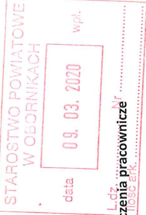
Tabela nr 11